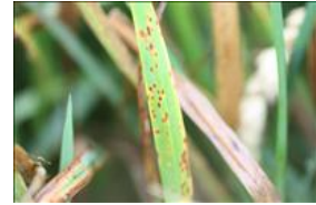
Mastigosporium bladplet.